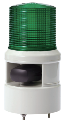
S100DL / S100DS